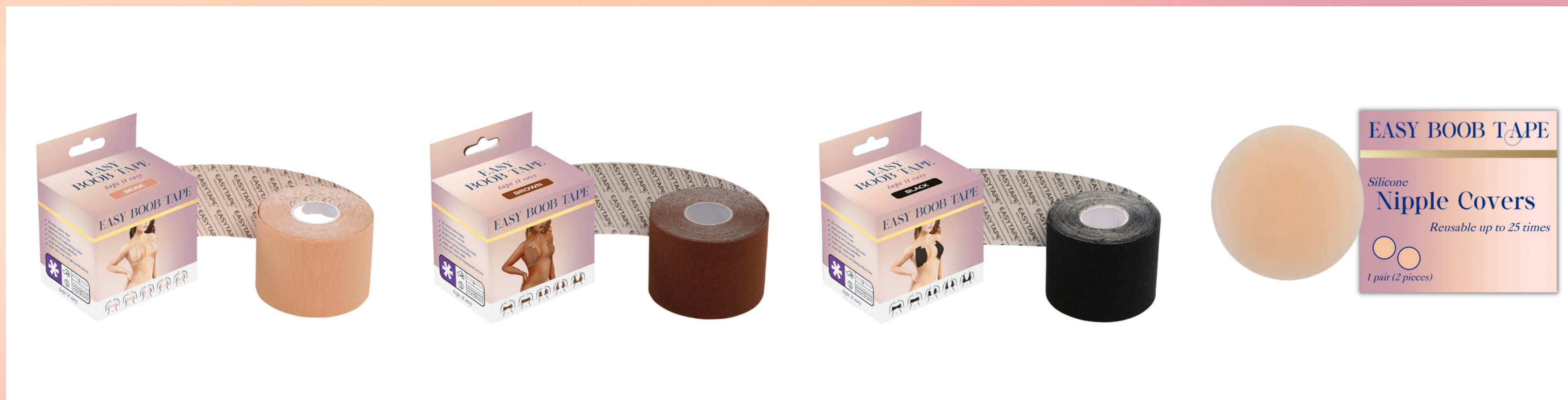
Easy BoobTape - Beige