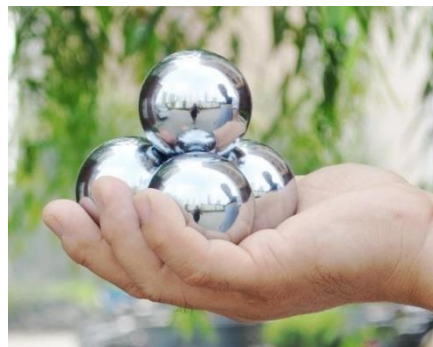
Figuur 2: Chinese metalen boading ballen zijn een voorbeeld van een object dat in de voerbak gebruikt kan worden als object waar het paard omheen moet eten.

Er zijn verschillende filmpjes op YouTube te vinden die de symptomen van slokdarm verstopping laten zien. U kunt op YouTube bijvoorbeeld zoeken op 'horse choking'. Er is een filmpje van een bruin bont paard van 0:55 seconden. De zogenaamde 'kokhals beweging' is te zien vanaf ongeveer 20 seconden.