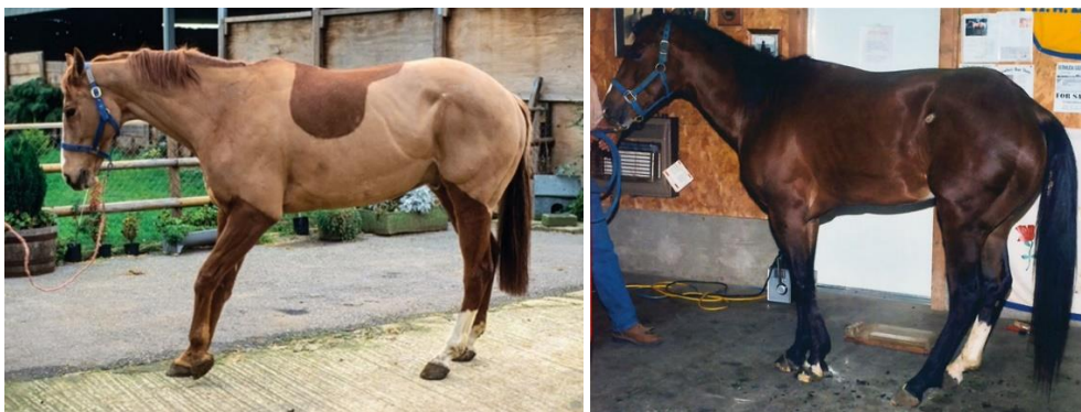
Afbeelding 1 en 2: Links is het paard hoefbevangen aan de voorvoeten. Hierdoor leunt het paard naar achter, om de pijnlijke voorvoeten te ontzien. Rechts is het paard hoefbevangen aan de achtervoeten, en leunt juist meer op de voorvoeten. Deze paarden lopen niet graag / 'lopen op eieren'.

(Zie onderaan dit document wat u bij hoefbevangenheid zelf kunt doen.)