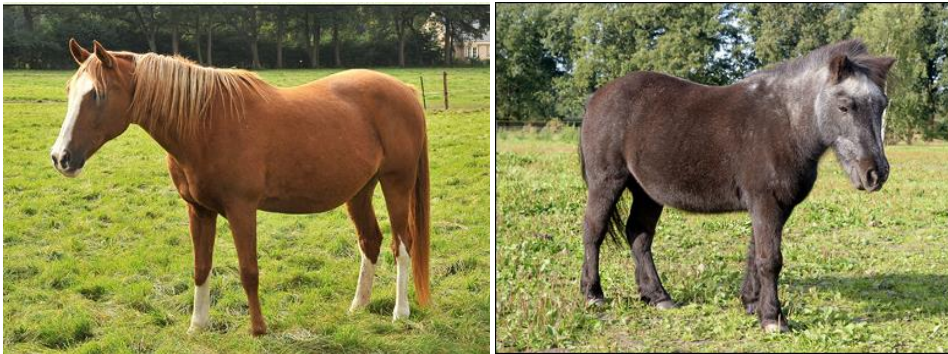
Afbeelding 1 en 2: Links een 31 jarige arabier met een mooie 'body condition score' en mooie vacht. Rechts een 39 jarige shetland pony met een mooie 'body condition score' en een mooie vacht. Ziet uw senior er niet helemaal gezond uit? Bel ons dan voor een gezondheidscontrole.