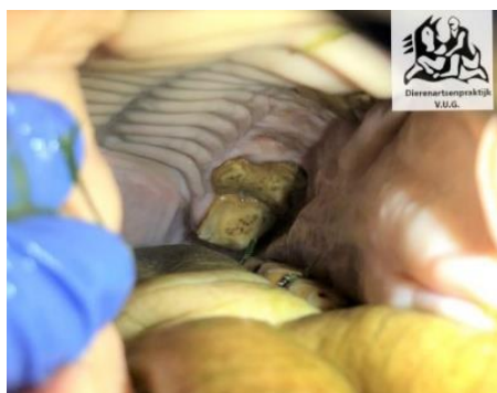
Afbeelding 6: Deze oude pony heeft nog maar 2 (ernstig versleten) kiezen bovenin. De kiezen in de onderkaak zitten er nog, maar kunnen niet werken zonder een kies er tegenover in de bovenkaak. Deze pony krijgt speciaal senioren slobber voer te eten en doet het daar goed op.

Mits op de juiste manier toegepast, kunnen paarden hier prima gelukkig oud mee worden. Wordt zo'n paard toch alleen 'normaal' ruwvoer gevoerd, dan bestaat er een risico op slokdarmverstopping, vermagering, koliek, diarree, etc.