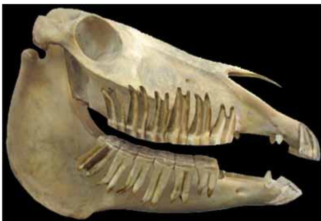
Afbeelding 3: De kiezen van dit jonge paard zitten diep in het kaakbot verankerd. Maar een klein deel steekt in de mondholte uit.

De kiezen van een jong paard zijn wel ongeveer 10cm lang! Ze zitten voor het grootste gedeelte (ongeveer 75%) in het kaakbot en steken maar voor een klein deel in de mond uit. Ze zitten dus diep verankerd.